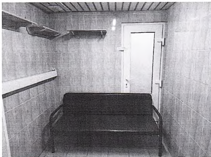
Раздевалка для мальчиков при спортивном зале